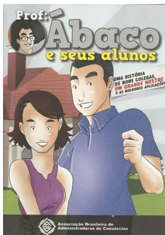
HISTÓRIA EM QUADRINHOS