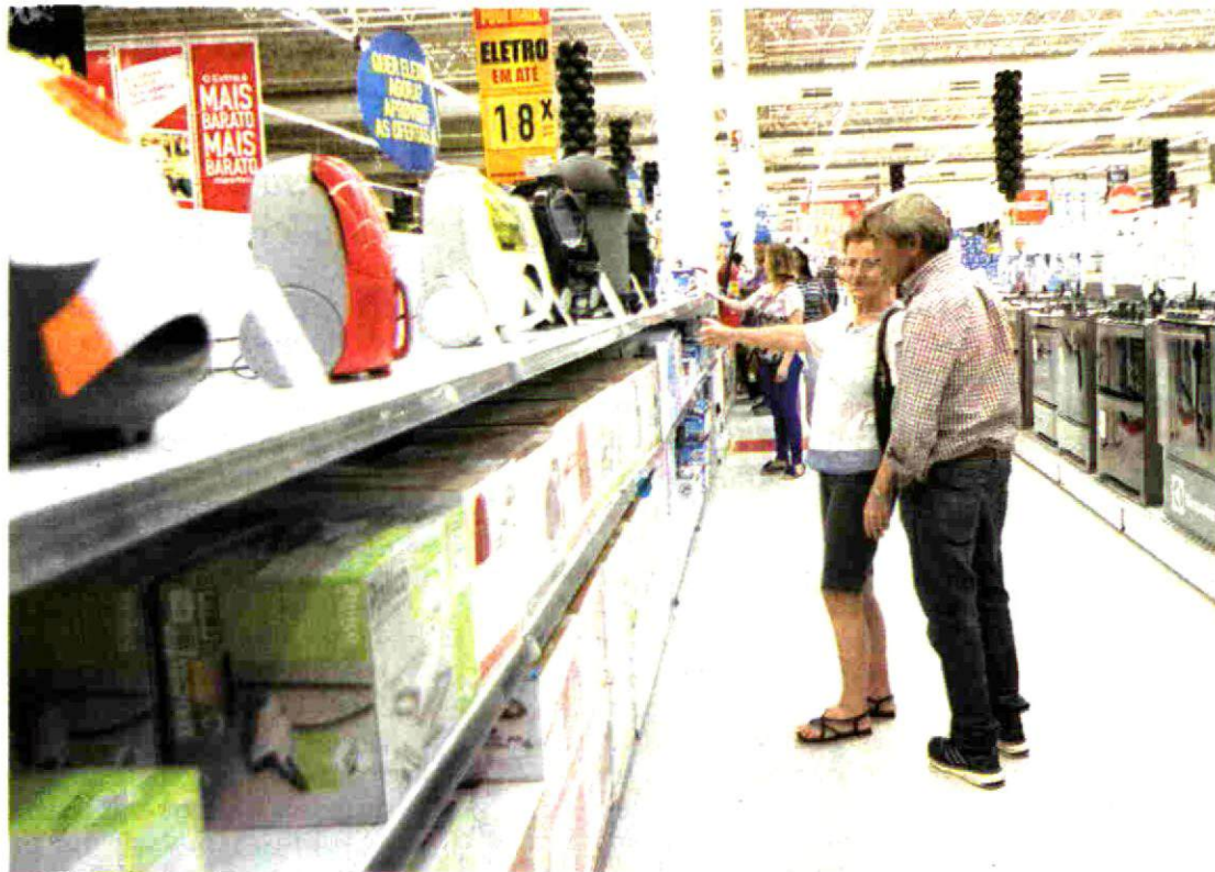
Selo informa a potência sonora e classifica os aparelhos de 1 (mais silencioso) a 5 (menos silencioso)

CONFORTO /Segundo Borges, manter essa indicação de ruído nos aparelhos é uma reivindicação antiga dos consumidores: "Por isso, é importante que eles conheçam o novo selo."