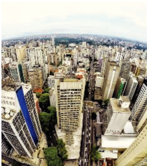
Compradores se afastaram dos financiamentos

A Abac atribui a expansão do setor ao cenário econômico atual, que inclui alta da inflação e das taxas de juros, além de mudanças nas regras para financiamento de imóveis. “O consumidor brasileiro tem